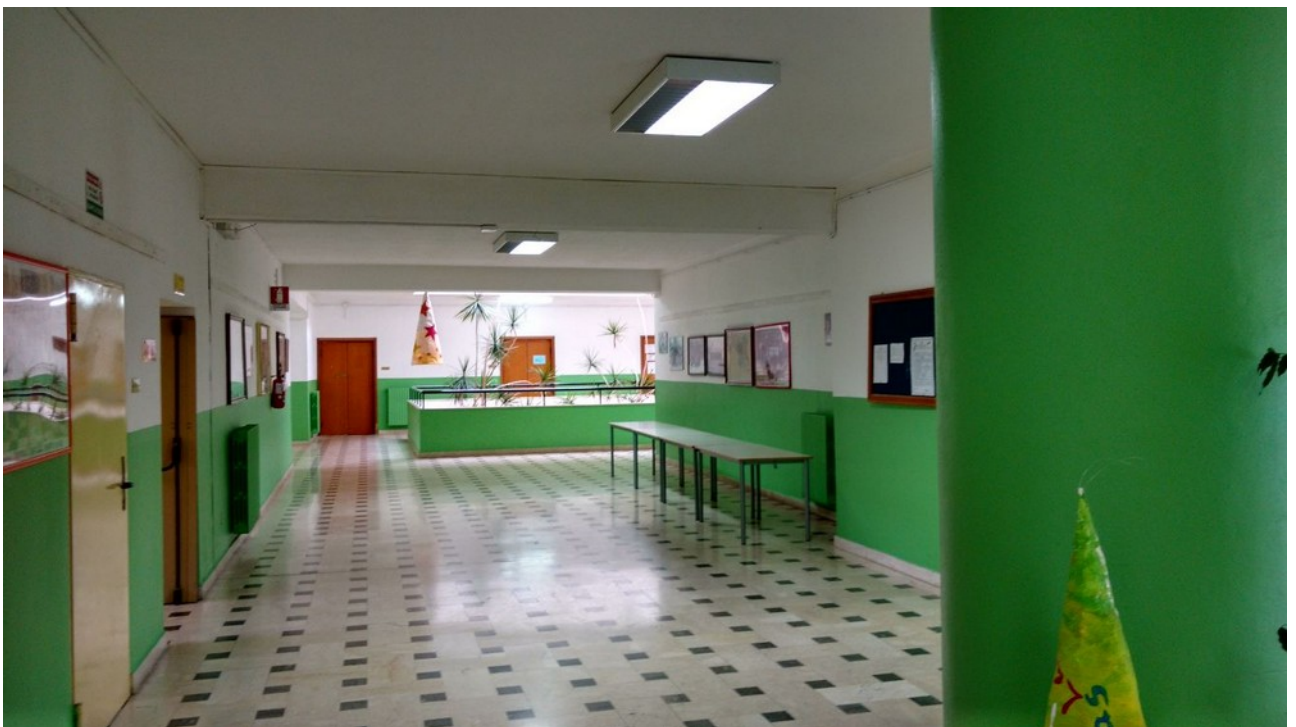
Veduta interna – disimpegno