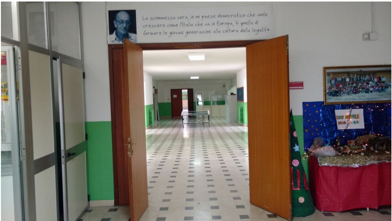
Veduta interna – disimpegno zona palestra