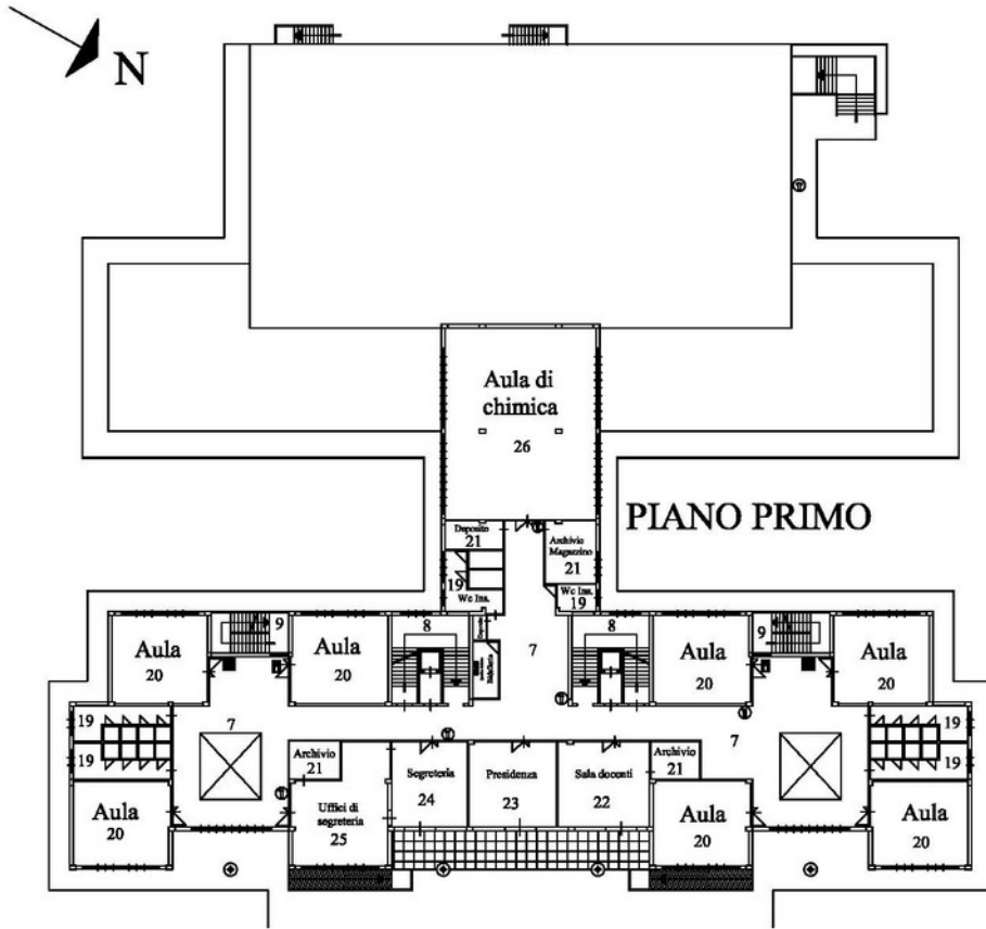
Planimetria piano PRIMO