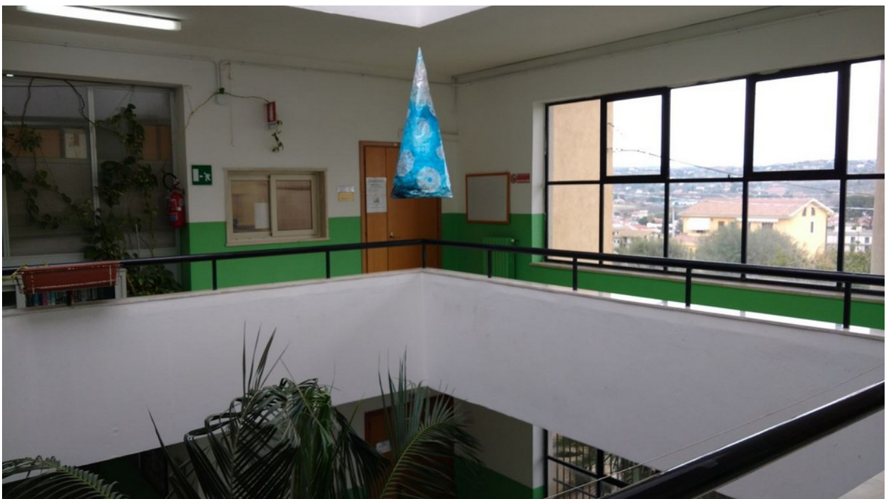
Veduta interna - disimpegno