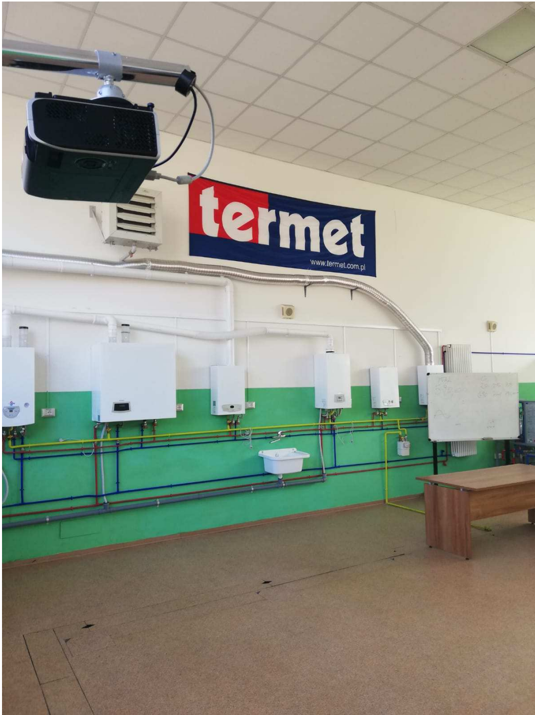
Veduta interna – laboratorio