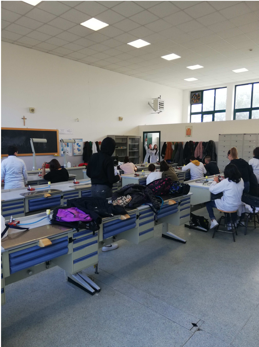
VEDUTA INTERNA LABORATORIO