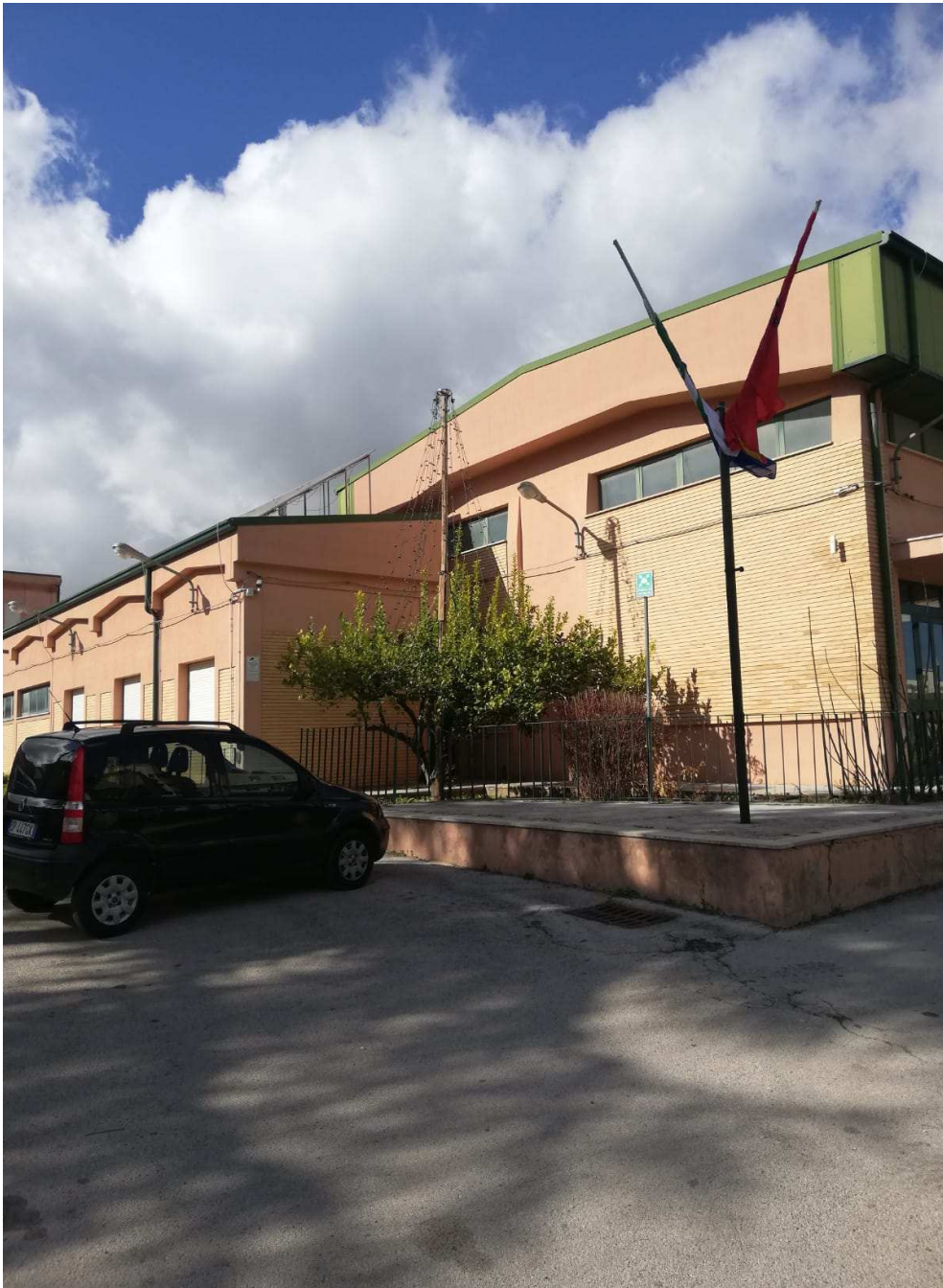
Veduta esterna – zona palestra