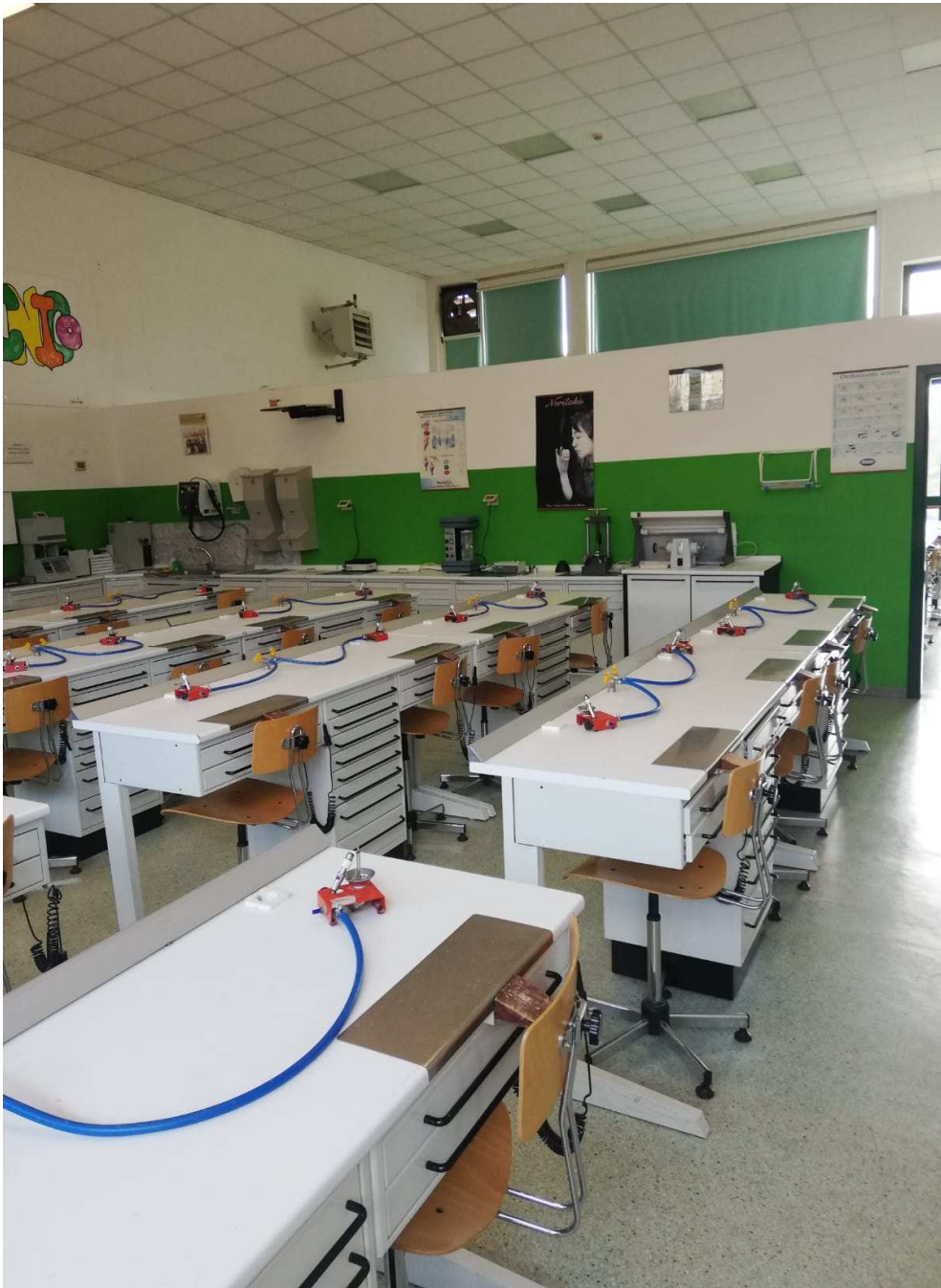
Veduta interna – Laboratorio