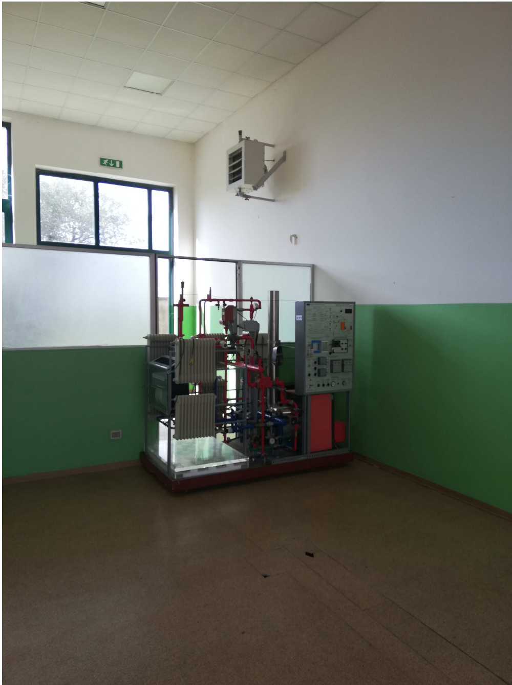
Veduta interna – laboratorio